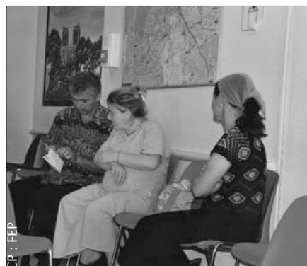
CF : FEP

Par ailleurs, ils apportent une diversité de cultures, de talents, de compétences, qui enrichissent l'action que nous portons.